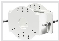
EDC-PM7-W | Artikelnummer: 220492